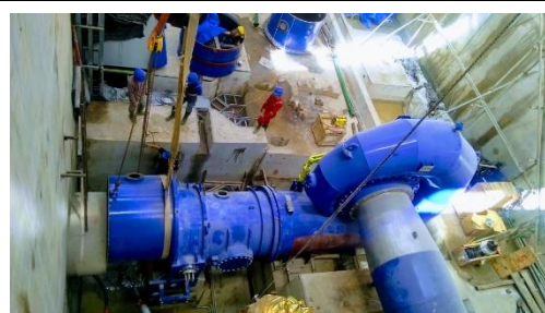
発電タービン手前の清流装置セット