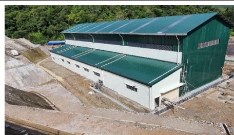
パワーハウス（発電機室）と コントロールルーム全景