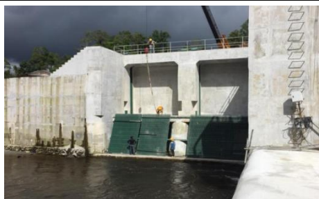
取水口の防ゴミネット設置